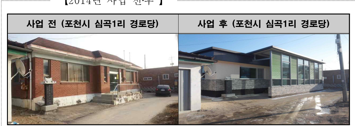
【2014년 사업 전·후】